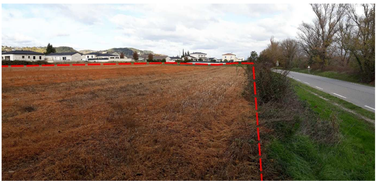
Vue proche vue 3