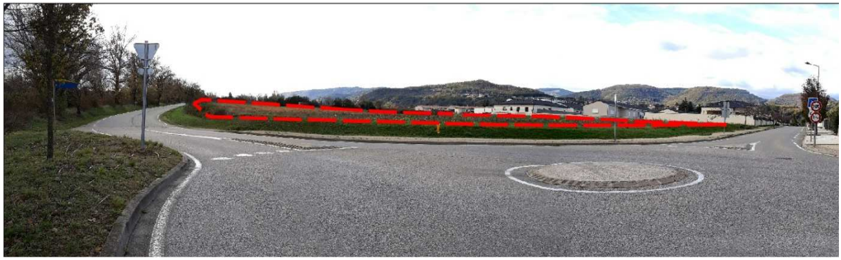
Vue proche vue 1