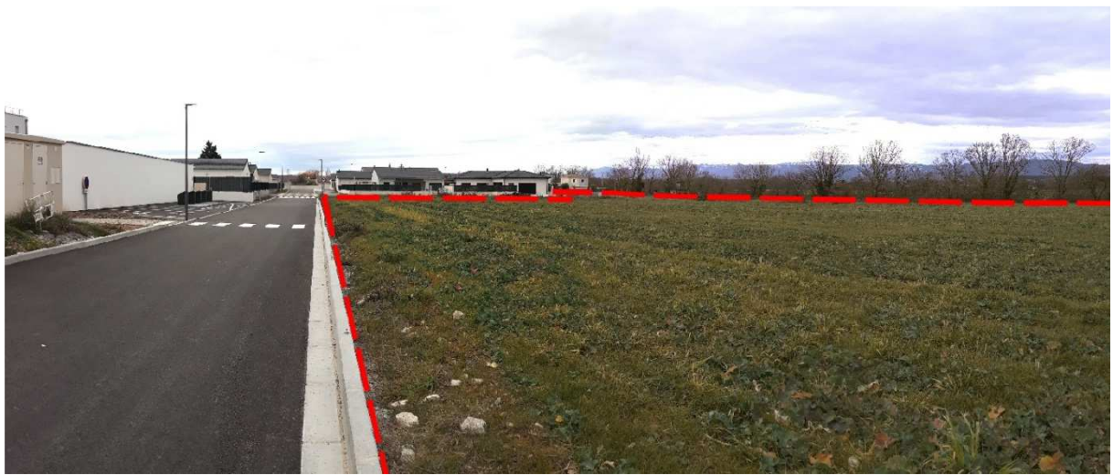
Vue proche vue 2